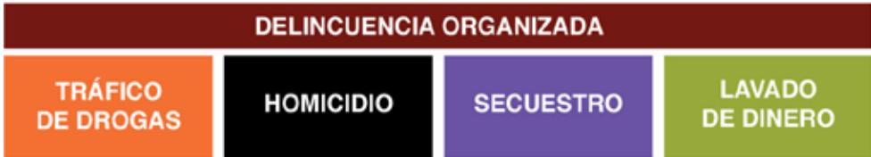
Lógicamente presupone un primer nivel de delito llamado Delito Predicado. Aún cuando sea un delito autónomo

En el caso de los delitos en materia de trata de personas, sigue la misma lógica, ya que la Ley General establece que por toda acción u omisión dolosa de una o varias personas para captar, enganchar, transportar, transferir, retener, entregar, recibir o alojar a una o varias personas con fines de explotación se impondrá de 5 a 15 años de prisión y de un mil a veinte mil días multa, sin perjuicio de las sanciones que correspondan para cada uno de los delitos cometidos, previstos y sancionados en la Ley General y en los códigos penales correspondientes.